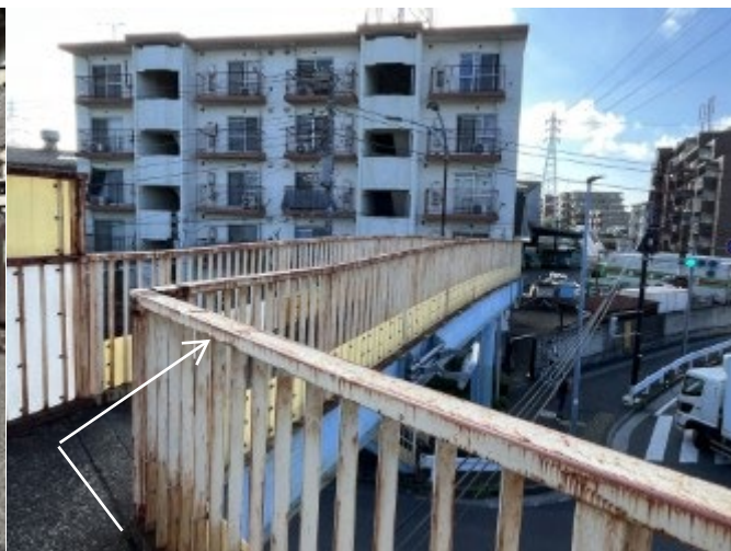
4. バス通り（尻手黒川道路）を渡ったら、右折する