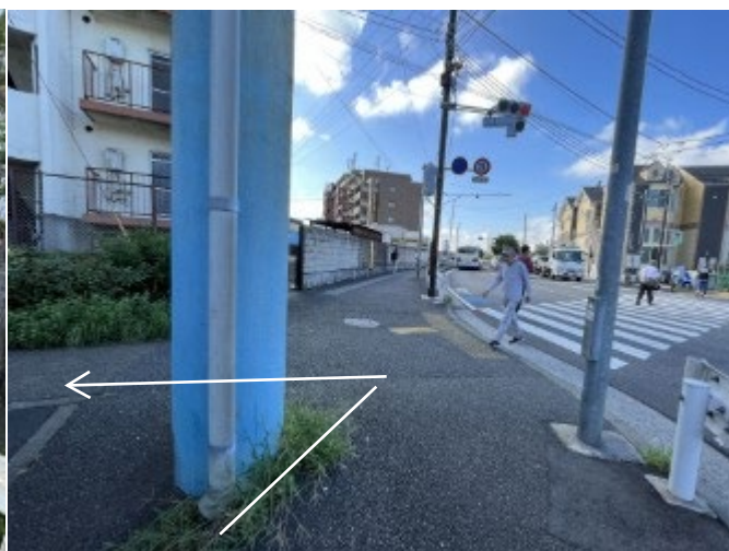
6. 交差点を渡らず、反対方向へ進む