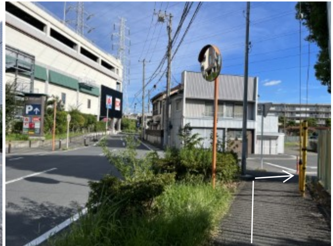
10. 交差点を右折する