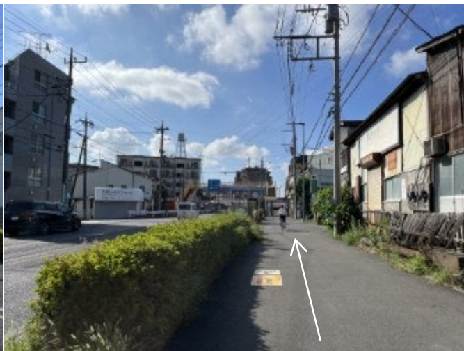
2. 歩道橋に向かって進む