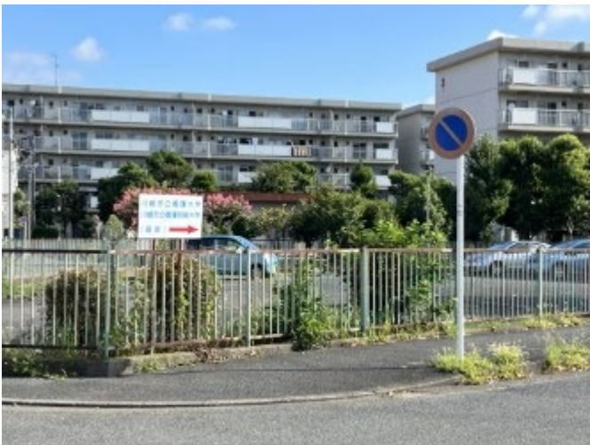
11. 右折方向に看板がある