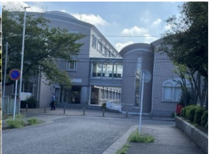
12. 川崎市立看護大学到着