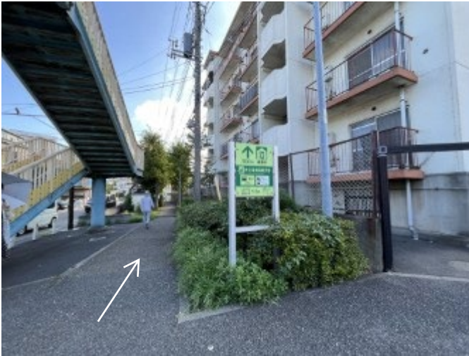
7. 川崎市立看護大学の看板にある矢印の方向へ進む