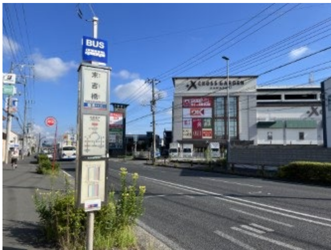
1. バスを降りたら、バスの進行方向の逆に進む