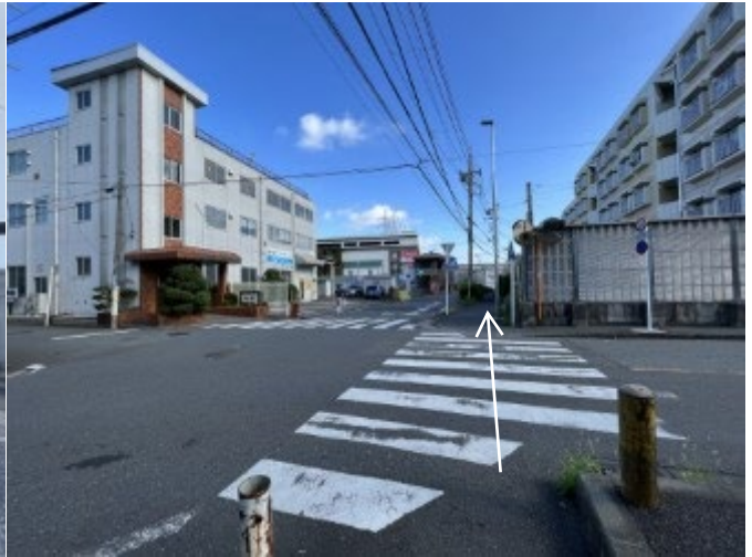
8. 交差点を直進する