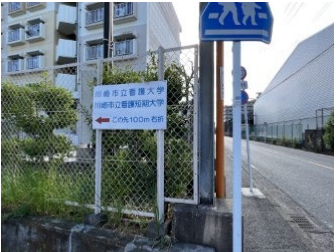
9. 交差点を渡り直進する